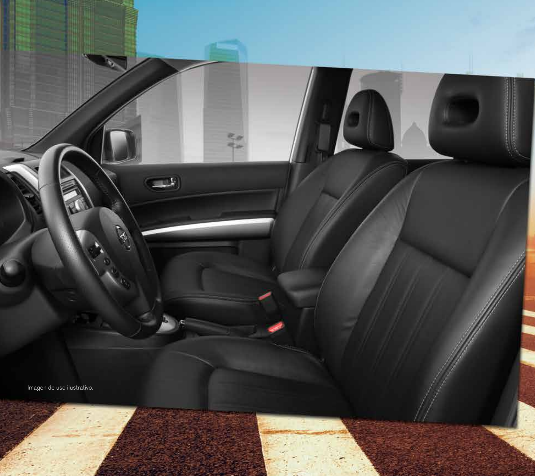
Imagen de uso ilustrativo.