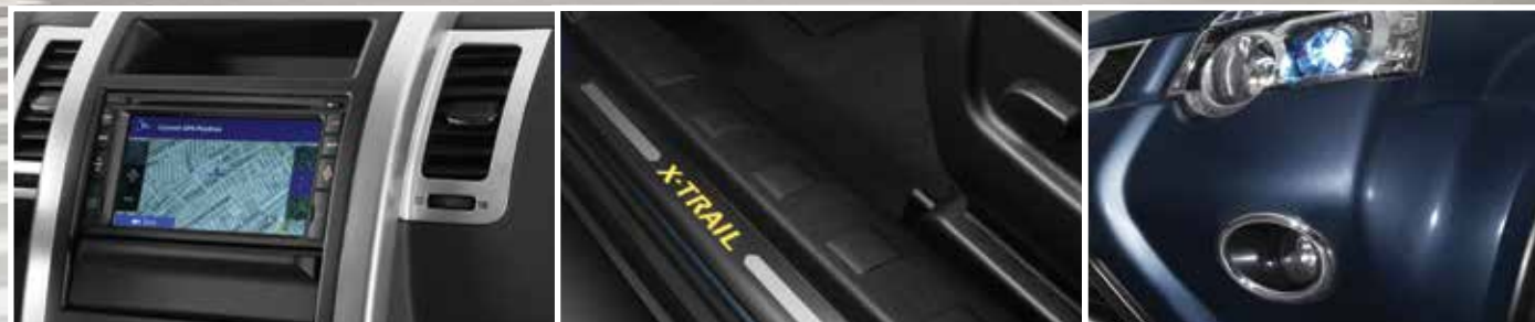
Radio con pantalla táctil de 6.2"