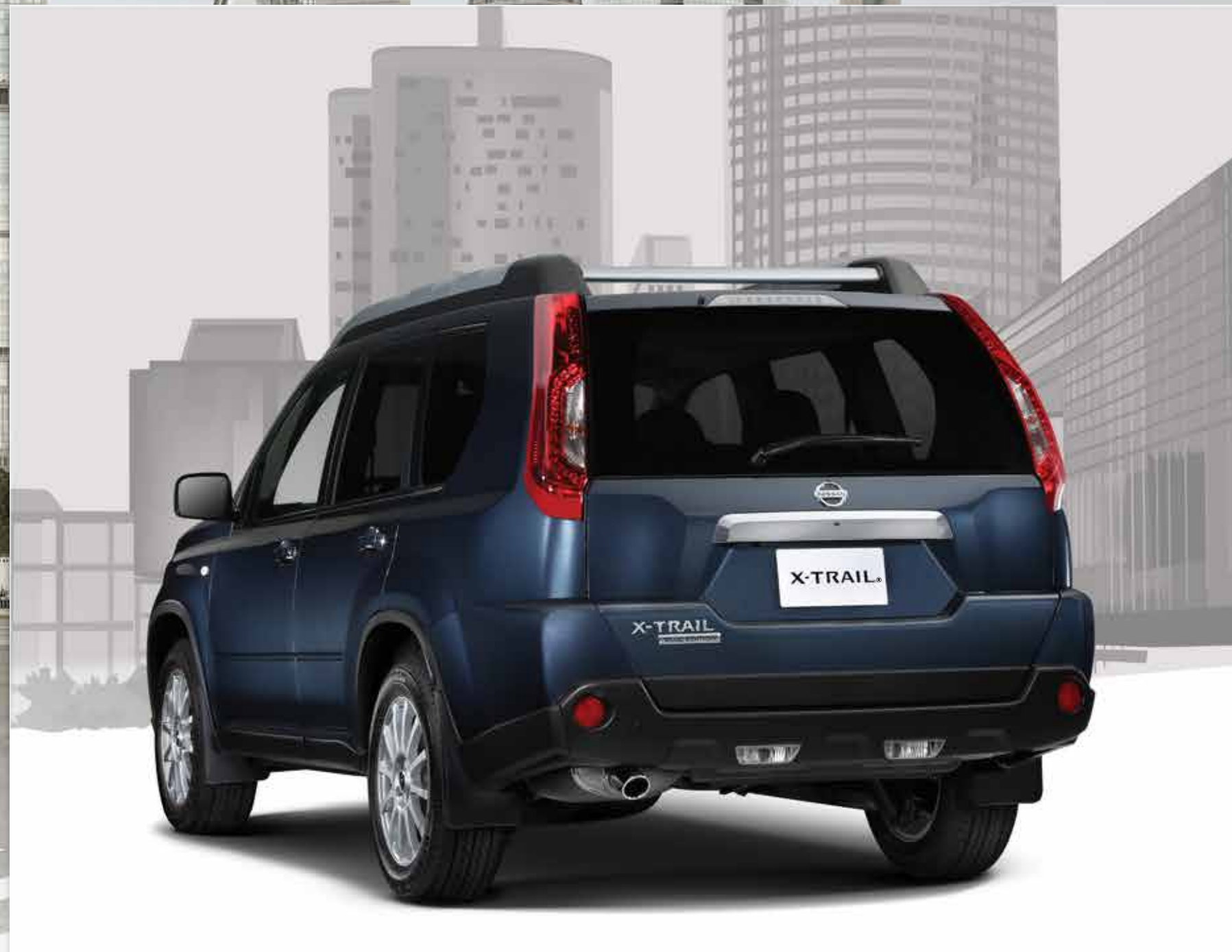
Faros de niebla cromados