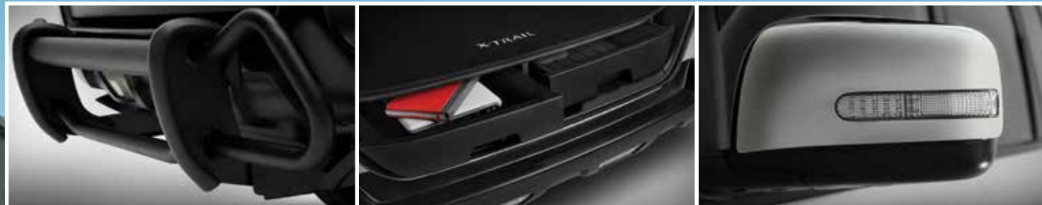
Protector de fascia trasera