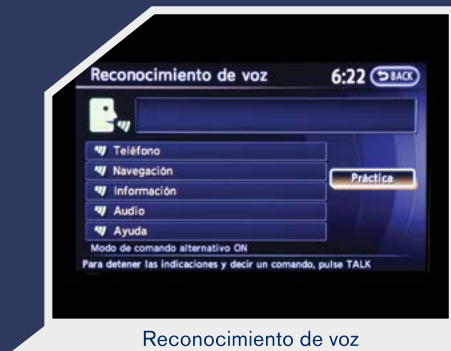
Reconocimiento de voz