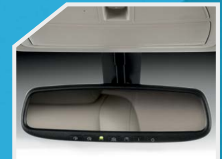
Espejo retrovisor antideslumbrante eléctrico y HomeLink®

Consulta nivel de equipamiento y disponibilidad por versión con tu Distribuidor Autorizado Nissan o visítanos en nissan.com.mx