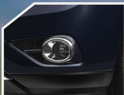
Faros aerodinámicos y de niebla delanteros