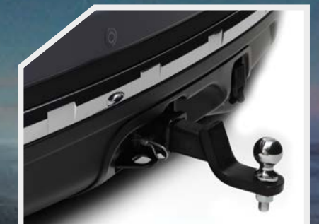
Bola de remolque