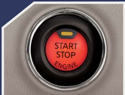
Botón de encendido