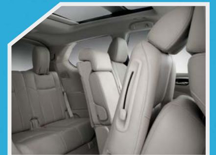
Asientos deslizables y reclinables