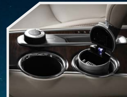
Cenicero con luz