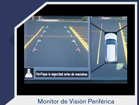
Monitor de Visión Periférica