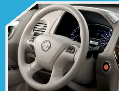
Volante con ajuste de altura y profundidad, forrado con piel