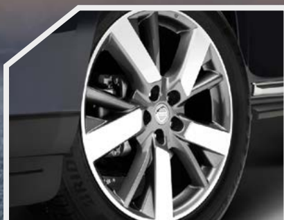
Rines de 20"