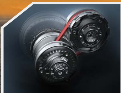
Transmisión CVT de segunda generación