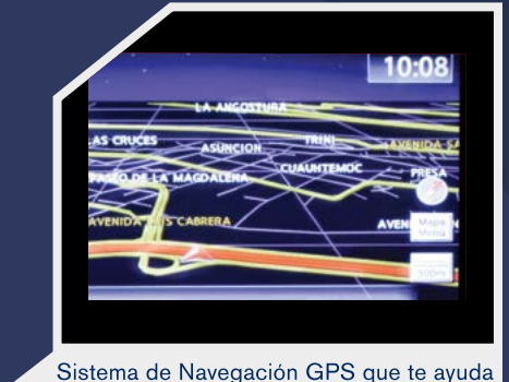
Sistema de Navegación GPS que te ayuda a encontrar sitios de interés

Consulta nivel de equipamiento y disponibilidad por versión con tu Distribuidor Autorizado Nissan o visítanos en nissan.com.mx