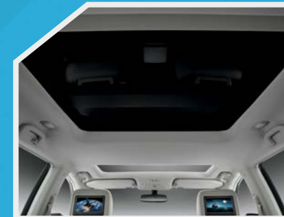
Quemacocos y techo panorámico