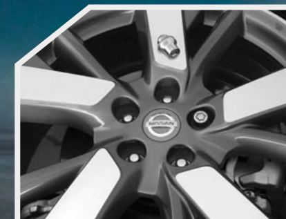
Tuercas de seguridad