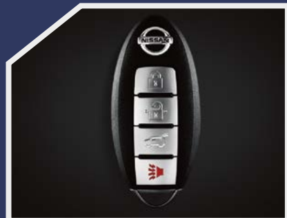
Llave inteligente iKey®

En Nissan Pathfinder ® puedo subir el volumen, disfrutar mi propia sala de cine, encontrar nuevos lugares y observar todo lo que me rodea, gracias a sus monitores independientes de 7" en cabeceras delanteras, DVD con entradas auxiliares, control remoto, sistema de audio Bose® y 2 audífonos inalámbricos.