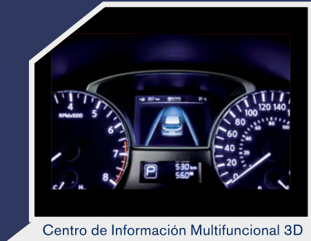
Centro de Información Multifuncional 3D